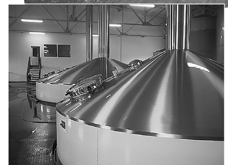
Subgefäße einer Brauerei vor und nach der Behandlung mit plus 3000 Upper face of a brewery vessel before and after treatment with plus 3000

Alle Angaben sind unverbindlich. Produkt ist vor dem Einsatz auf Eignung zu prüfen. Technische Änderungen vorbehalten.